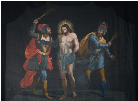
Biczowanie Chrystusa, tkanina wielkopostna, kościół św. Jana Chrzciciela w Orawce, XVIII wiek