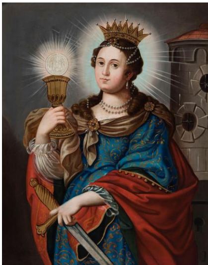
Św. Barbara, kościół św. Marcina w Jawiszowicach, przed 1708 rokiem

https://sdm.upjp2.edu.pl/dziela/sw-barbara-25