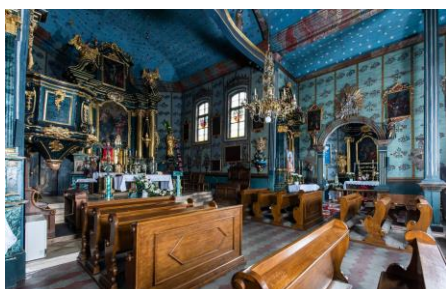
Kościół św. Apostołów Szymona i Judy w Łętowni, 1760-1765, 1776-1779

https://sdm.upjp2.edu.pl/dziela/kosciol-wniebowziecia-najswietszej-marii-panny-w-brodach