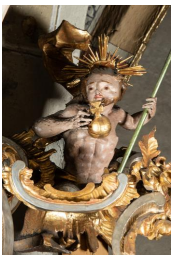
Fragment ambony w kościele św. Bartłomieja Apostoła w Niedzicy, 1770 rok

https://sdm.upjp2.edu.pl/dziela/ambona-91