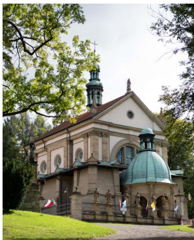
Kościół Wniebowzięcia Najświętszej Marii Panny w Brodach, 1611-1615, 1623-1630

https://sdm.upjp2.edu.pl/dziela/kosciol-nawiedzenia-najswietszej-marii-panny