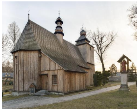
Kościół pw. Nawiedzenia Najświętszej Marii Panny w Paczółtowicach, 1515-1528

https://sdm.upjp2.edu.pl/dziela/kosciol-nawiedzenia-najswietszej-marii-panny