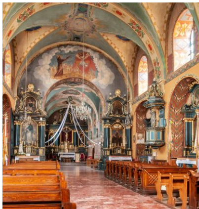
Kościół św. Franciszka z Asyżu w Wieliczce, 1624-162

https://sdm.upjp2.edu.pl/dziela/sw-barbara-25